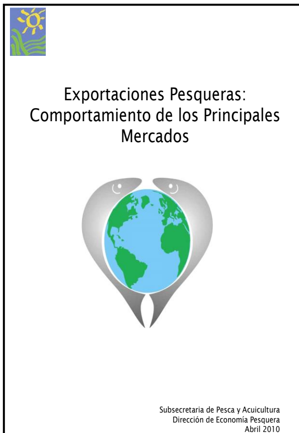
Exportaciones Pesqueras - Informe anual 2010

http://www.minagri.gob.ar/SAGPyA/pesca/pesca_maritima/04=informes/05-economia_pesquera/index.php