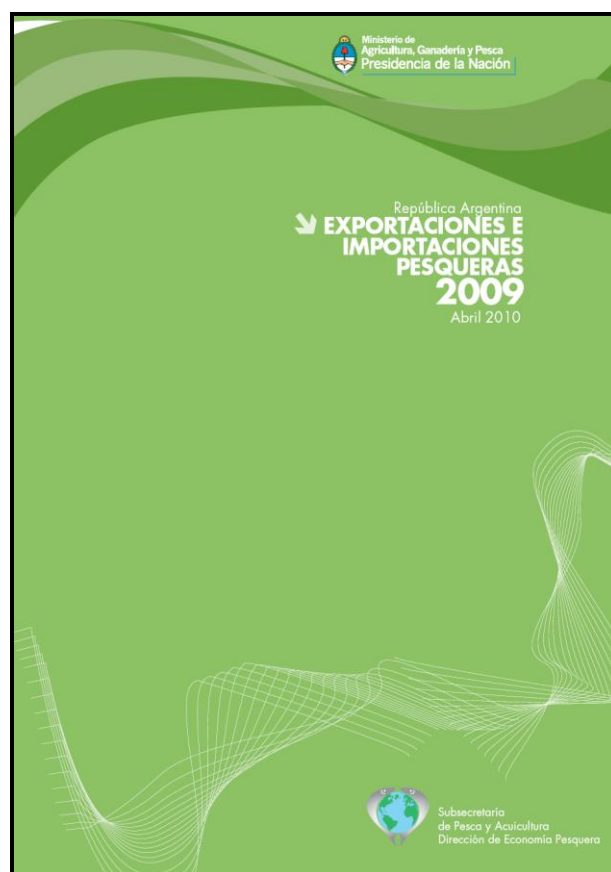
Exportaciones e Importaciones Pesqueras 2009